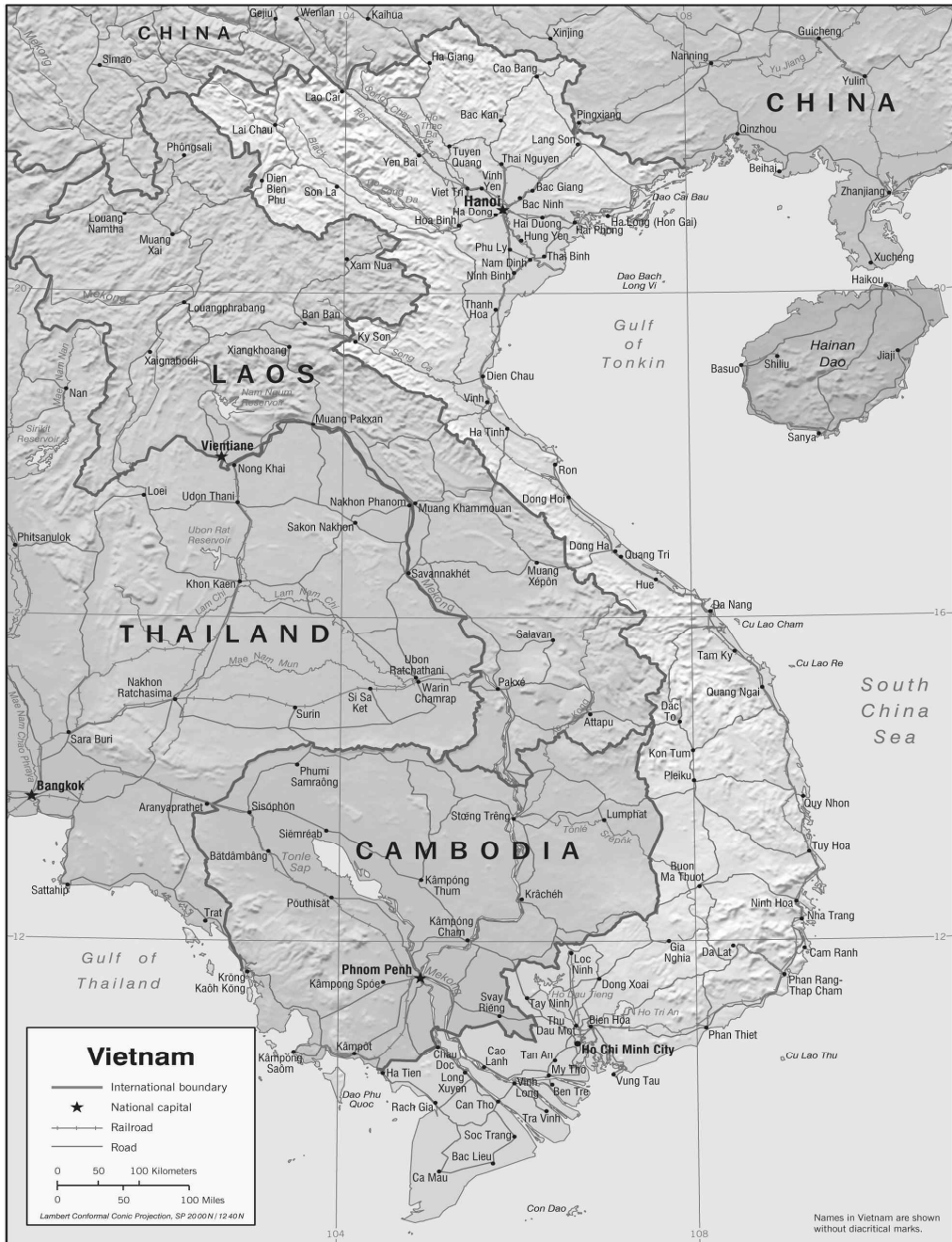
Base 802749AI (C00082) 8-01